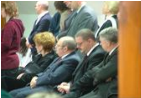
Међу високим званичницима били су и представници Републике Мађарске