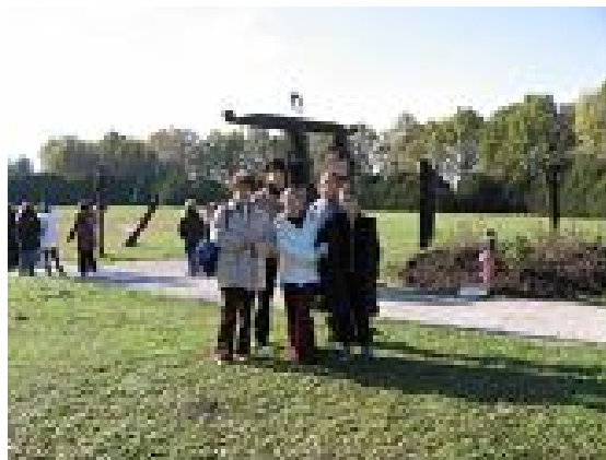
На месту одржавања Мохачке битке