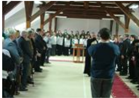
Освештавање нове друштвене сале

Након ручка у хотелу “Ројал“, у свечаној сали СО Сента одржана је свечана академија, у којој су учествовали ученици наше и братских гимназија, позваних да својим присуством увеличају нашу прославу.