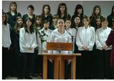
Академија у свечаној сали СО Сента